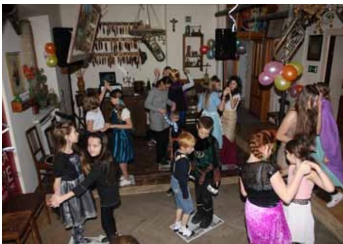
ZABAWA ANDRZEJKOWA MAŁEGO ORATORIUM, fot. kl. Sebastian

23 listopada w Oratorium na Herbach odbyła się zabawa andrzejkowa, którą rozpoczęła modlitwa do Anioła Stróża, następnie zapadły „ciemności egipskie” bowiem z niewiadomych przyczyn zgłosiło światło w całym budynku. Szybko dało się opanować sytuację i zabawa rozpoczęła się na całego.