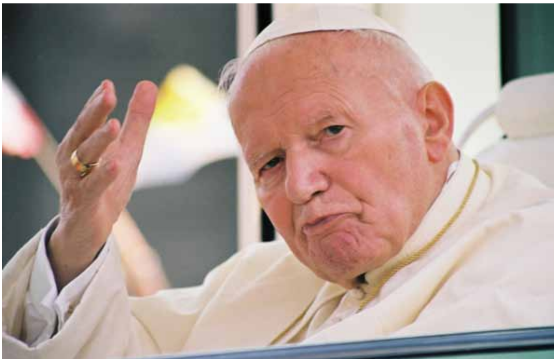
JAN PAWEŁ II W KRAKOWIE