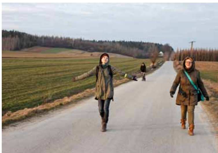
RAJD Z OKAZJI DNIA KOBIET